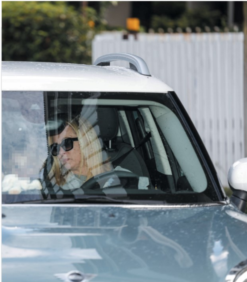
Ieri Giorgia Meloni a Roma mentre torna a casa in auto con sua figlia

ARTICOLO NON CEDIBILE AD ALTRI AD USO ESCLUSIVO DEL CLIENTE CHE LO RICEVE - L.1992 - T.1622