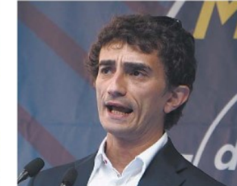
Galeazzo Bignami, Fdi