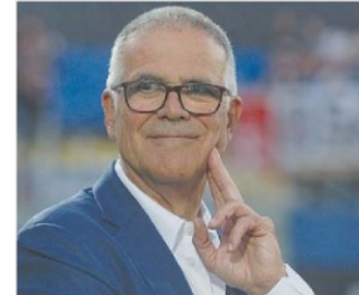
Paolo Zangrillo, Forza Italia