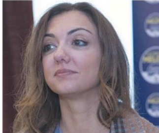
Augusta Montaruli, Fratelli d'Italia